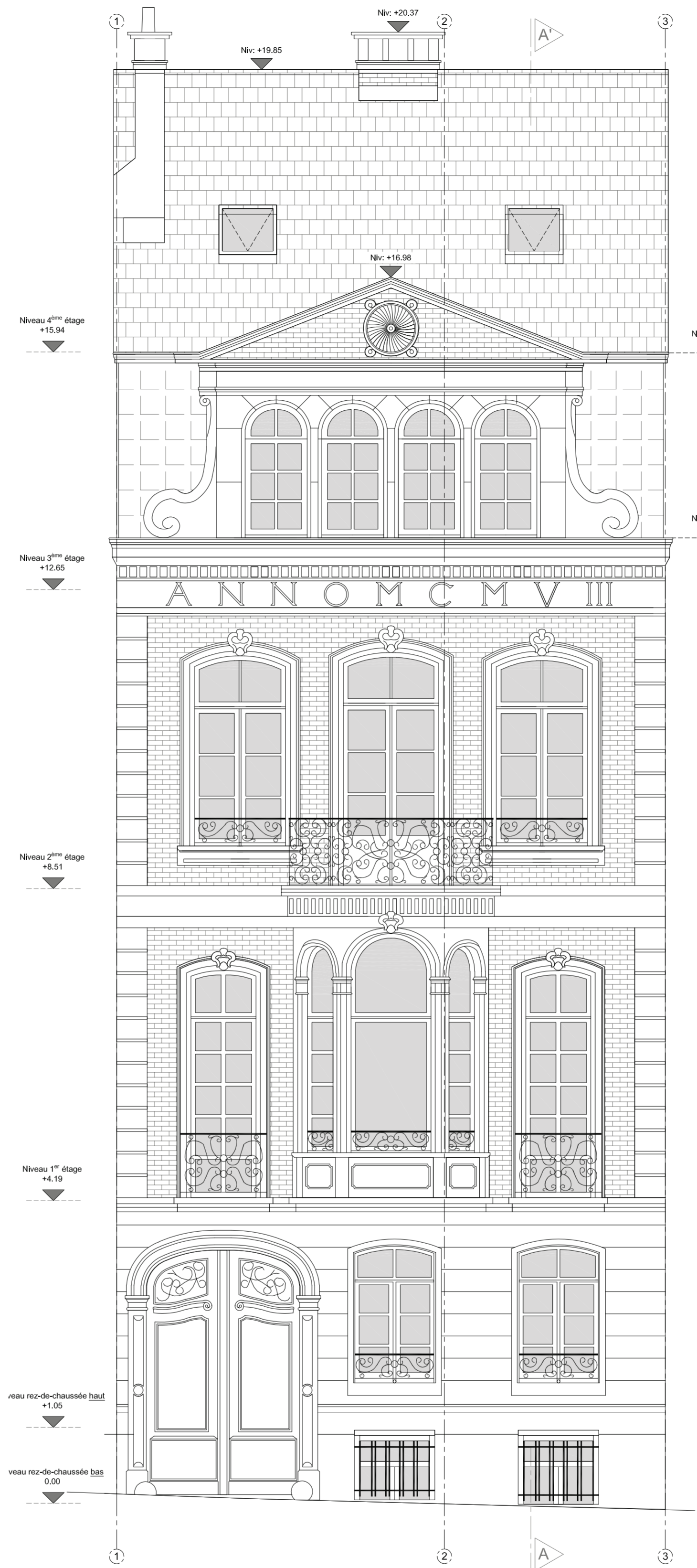
Façade avant échelle 1/50