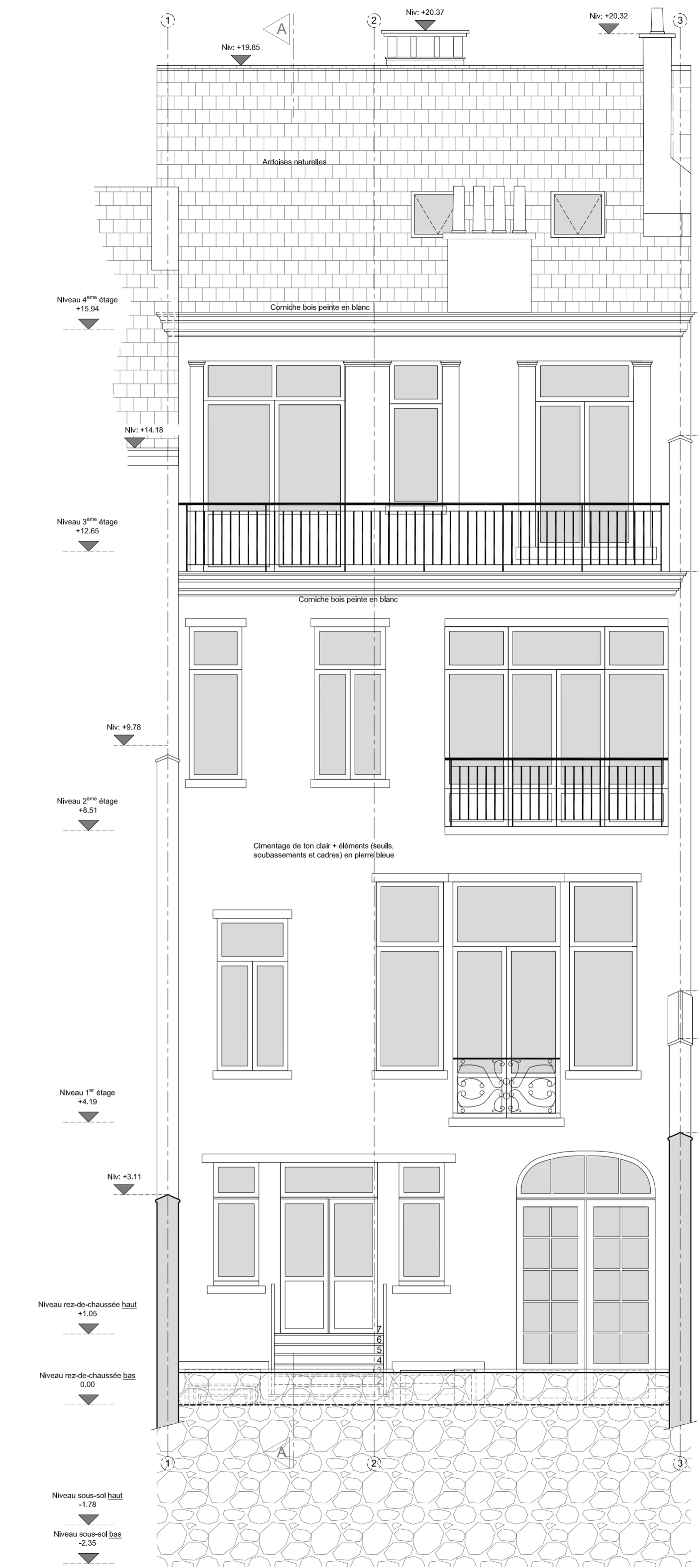
Façade arrière échelle 1/50